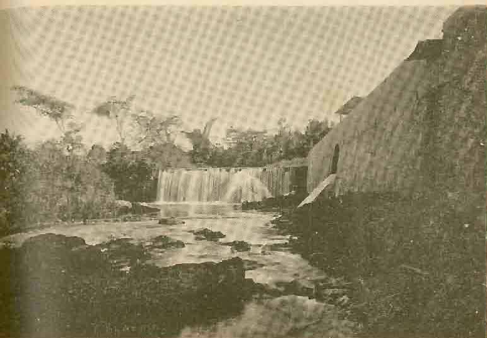
TOMA DE AGUA DE LA GRAN CERVECERÍA «TRAUBE»